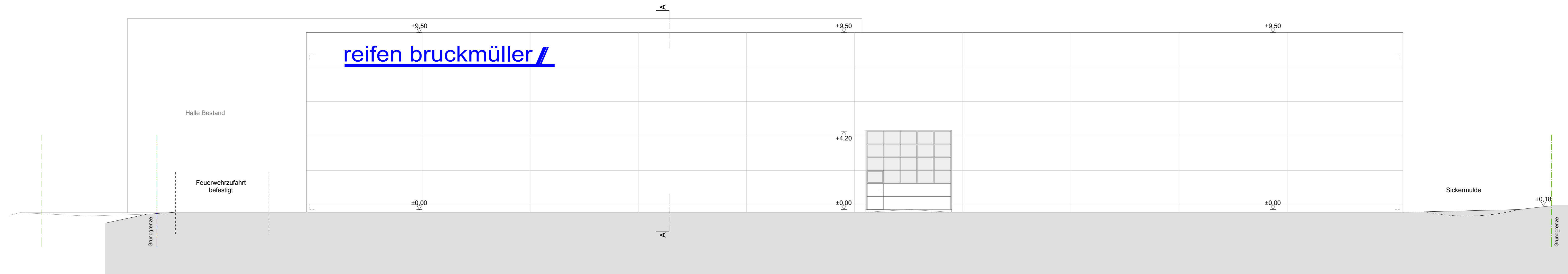
Ansicht Süd M1:100